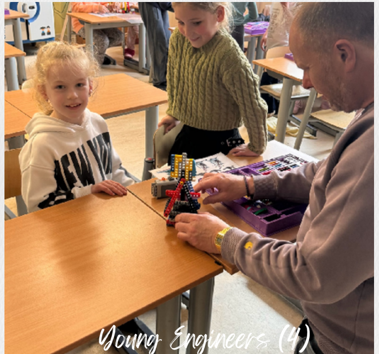
Young Engineers (4)