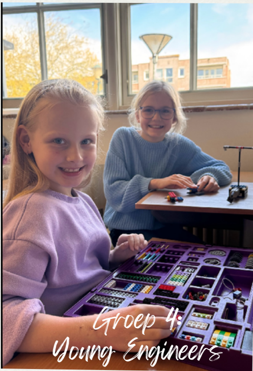
Groep 4: Young Engineers